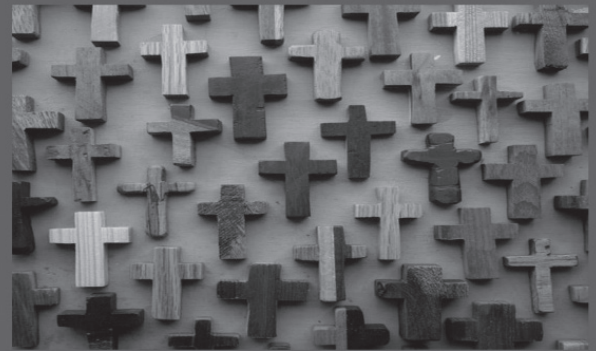
Kreuze der JVA Hinzistobel - Kirche in der Stadt Ravensburg

eigene Gedanken formulieren - Trost finden