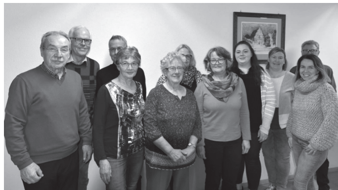
Spendenempfänger und Mitglieder des Veranstaltungsausschusses Liebfrauen.

Der Veranstaltungsausschuss – ein aktiver Baustein im Leben der Gemeinde Liebfrauen – Seit über 20 Jahren bemüht sich eine Gruppe von Frauen und Männern, eine lebendige Gemeinde zu gestalten. Mit viel Einsatzbereitschaft wurden viele Feste durchgeführt, um die Menschen bei Essen und Trinken in geselligem Rahmen Gemeinde erleben zu lassen. Die Gemeindefeste in Liebfrauen oder das Patrozinium Heilig Kreuz, das Beisammensein der Seelsorgeeinheit an Fronleichnam, die Sichelhenke zusammen mit den Landfrauen, viele unvergessene Fasnetsbälle, Jubiläen, der Wallfahrtstag im Dezember – überall da war der Veranstaltungsausschuss präsent. Immer unterstützt durch die Mithilfe von zusätzlichen Helfern und durch zahlreiche Kuchenspenden – dafür auch nochmals unseren ganz herzlichen Dank – gelang es immer wieder, mit dem Erlös die unterschiedlichsten Projekte zu unterstützen. Im einem Zeitraum von über 20 Jahren konnten 20.000 EUR an Spenden verteilt werden. Aktuell erhielten in der letzten Sitzung die 4 Kindertagesstätten der Gemeinde Liebfrauen (St. Andreas, Gut Betha, Klösterle und Ludmilla), der Förderverein „Kreuzweg e.V.“, der Verein „Frauen und Kinder in Not e.V.“, das Projekt „Santa Fe“ und das Projekt „Einfach Essen“ Zuwendungen.